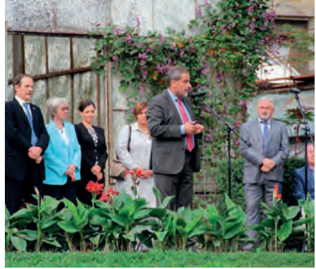
Gradonačelnik Milan Bandić pozdravlja uzvanike Sveučilišne vrtno zabave na kojoj je promoviran projekt obnove izložbenih staklenika (2013.)