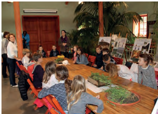
Radionica Botanička čarolija: igramo se herbariziranja! održana u sklopu trećeg Tjedna botaničkih vrtova i arboretuma Hrvatske (2013.)

Vrijedno je istaknuti da se stručni suradnici Botaničkog vrta, uz spomenuti stručni rad, bave i znanstvenim istraživanjima na području botanike. Rezultati njihova stručnog i znanstvenog rada mogu se naći u stručnim i znanstvenim publikacijama.