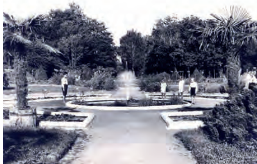
Fontana okružena bazenima s lopočima (1924.)