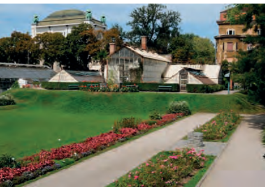
Stoljetnim staklenicima potrebna je obnova (2013.)