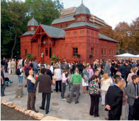
Sveučilišna vrtna zabava ispred izložbenog paviljona u Botaničkom vrtu (2011.)