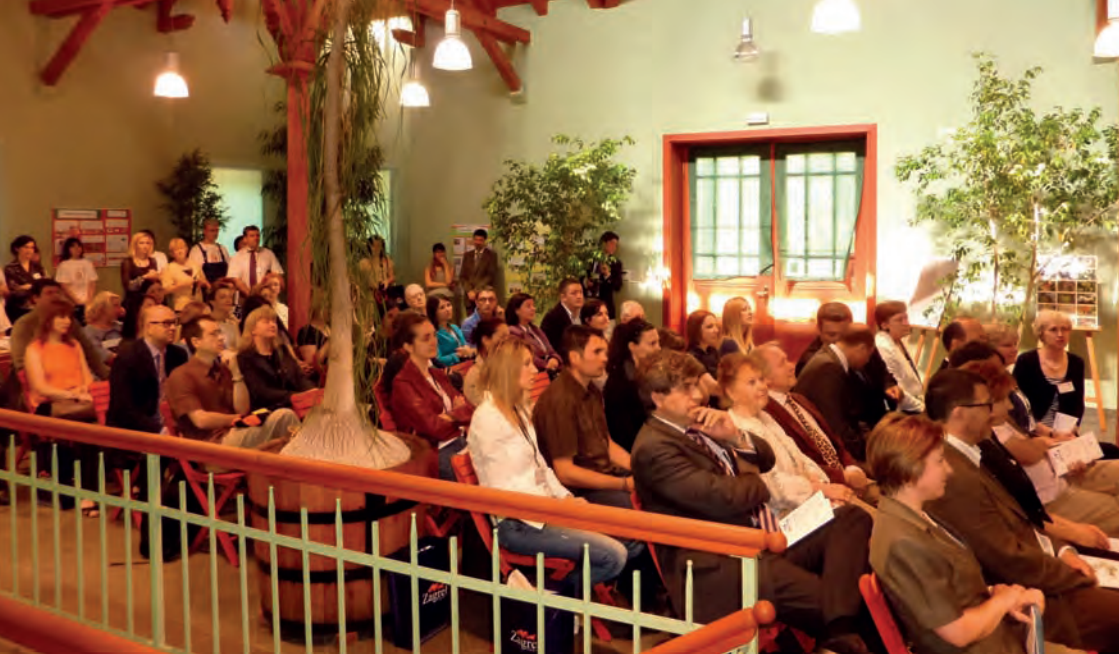
Svečano otvaranje Tjedna botaničkih vrtova i arboretuma Hrvatske u izložbenom paviljonu Botaničkog vrta (2011.)