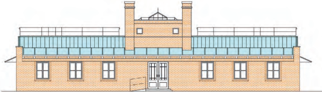
Projekt rekonstrukcije izložbenih staklenika, pročelja (autor arhitekt konzervator Mladen Perušić, 2013.)