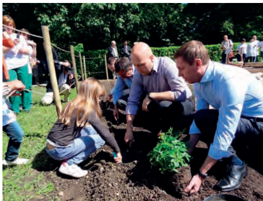
I veliki i mali siju i sade u novom Dječjem povrtnjaku i cvjetnjaku (2013.)