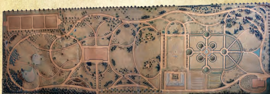
Nacrt Botaničkog vrta iz godine 1889.

Botanički vrt danas je sastavni dio niza lijepih starih zagrebačkih trgova i perivoja poznatih pod nazivom Lenučijeva ili Zelena potkova . Zbog svoje velike obrazovne, kulturno-povijesne i turističke vrijednosti, kao i sveukupnog značenja za grad Zagreb i Republiku Hrvatsku, Botanički vrt od 1971. godine zakonom je zaštićen kao spomenik parkovne arhitekture. Vrt je također upisan u Registar kulturnih dobara Ministarstva kulture te je zaštićen kao izvorno gradograditeljsko ostvarenje te kao dovršeni, urbanistički, arhitektonski i parkovno oblikovan prostor .