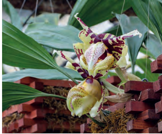
U tropskim staklenicima već desetljećima uzgajamo rijetku i endemičnu vrstu orhideje Stanhopea hernandezii , koja potječe iz Meksika

nazivlje. Obnova izložbenih staklenika doprinijela bi cjelovitosti povijesnog arhitektonskog nasljeđa u perivojnom okviru zagrebačkog Donjeg grada, a građanima ponovno omogućila razgledavanje tropskog bilja koje se uzgaja u zatvorenom prostoru. Obnova izložbenih staklenika i nastavak obogaćivanja djelatnosti Botaničkog vrta i obnove vrijednih građevina planira se izvesti uz pomoć Grada Zagreba i sredstava europskih fondova. U vezi s time, vrijedno je istaknuti da je izrađen projekt HORTUS (Hrvatski komadić raja tragom europskog sjaja) koji je 2013. godine prihvaćen na natječaju Ministarstva regionalnoga razvoja i fondova Europske unije u okviru Programa pripreme i provedbe razvojnih projekata prihvatljivih za financiranje iz fondova Europske unije. Nadamo se da će sljedeće godine započeti radovi na obnovi izložbenih staklenika, a potom i realizacija cijelog projekta HORTUS.