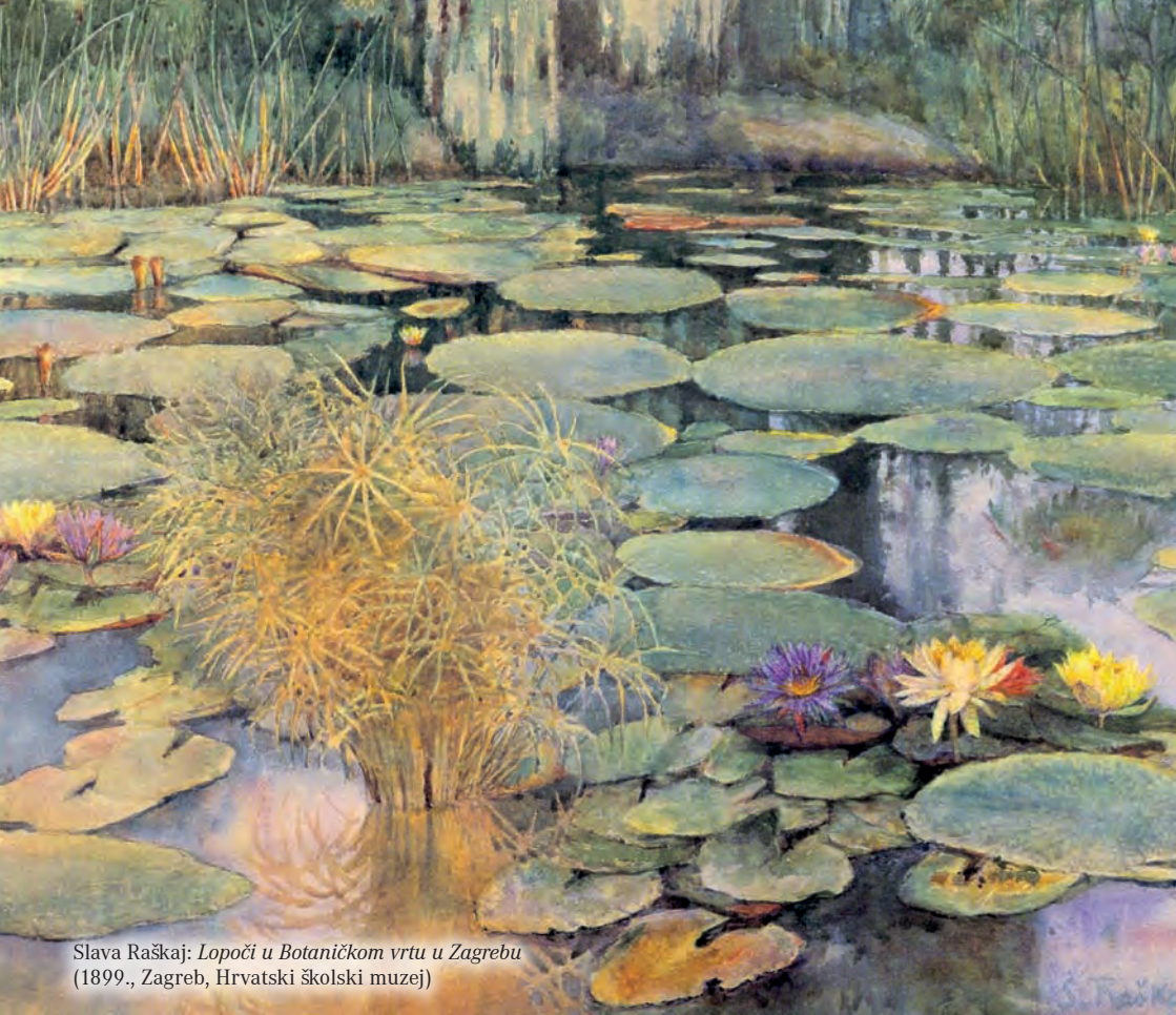
Slava Raškaj: Lopoči u Botaničkom vrtu u Zagrebu (1899., Zagreb, Hrvatski školski muzej)