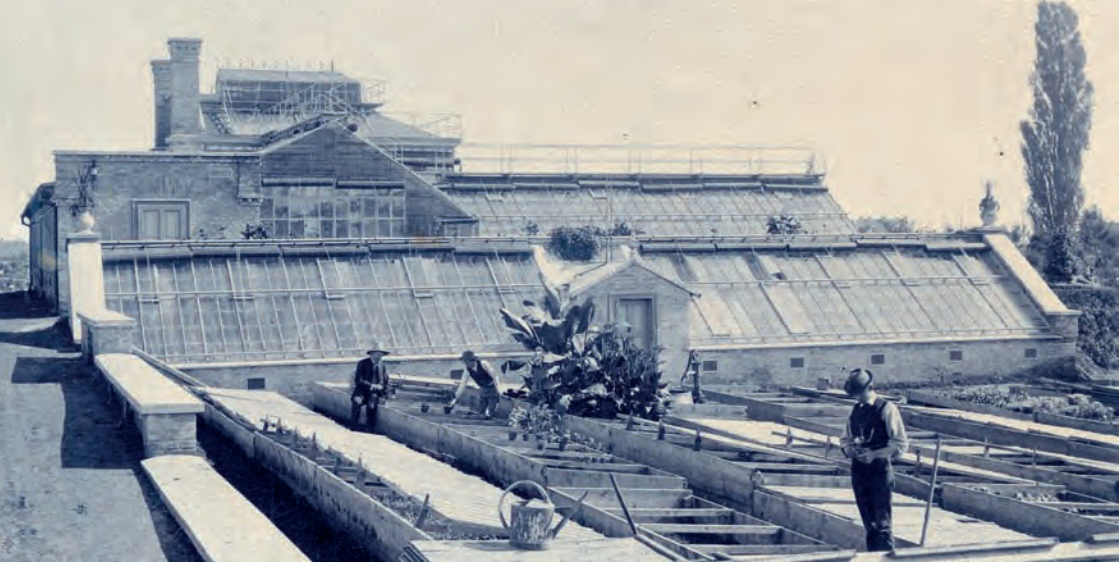
Staklenici i klila (1895.)