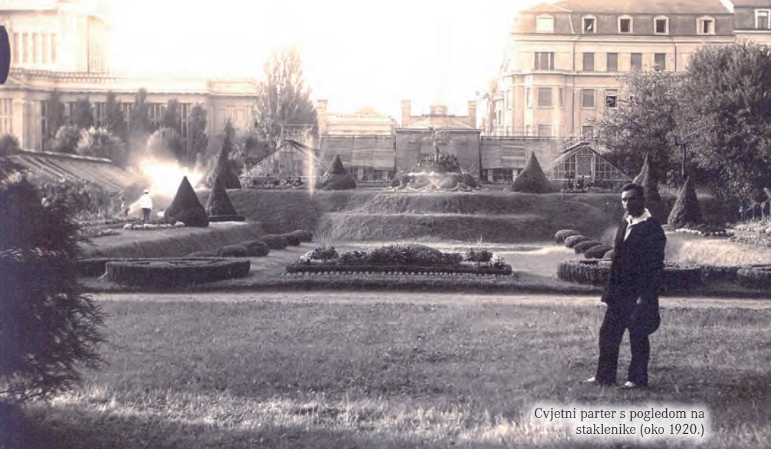
Cvjetni parter s pogledom na staklenike (oko 1920.)

Svega desetak godina nakon osnutka Botanički je vrt već imao vrlo bogatu i raznoliku zbirku biljaka, koja danas sadrži više od 5000 različitih svojta. Manje osjetljive drvenaste biljke (drveće i grmlje) uzgajaju se u arboretumu, a osjetljivije vrste iz toplijih područja prezimljavaju u staklenicima. Uresne zeljaste biljke uzgajaju se na cvjetnom parteru, oko jezera i na gredicama cvjetne duge . Posebno vrijedan dio zbirke čine samonikle biljne vrste, predstavnici vrlo brojne i raznolike hrvatske flore, koje se uzgajaju u biljnogeografskim skupinama – kamenjarama (krška, dvije mediteranske, submediteranska). Osobito se ističe gotovo 300 zakonom zaštićenih vrsta hrvatske flore, a dvije najpoznatije hrvatske endemične biljke, velebitska degenija i dubrovačka zečina, povremeno se mogu i nabaviti u Vrtu. Zbirka tropskih i subtropskih biljaka uzgaja se u staklenicima, a tijekom ljeta biljke se iznose na otvoreni prostor. Močvarsko bilje raste u jezercima, u bazenima i u malom stakleniku na parteru. Vrijedan dio zbirke smješten je i na sistematskom polju koje je uređeno za potrebe sveučilišne nastave botanike.