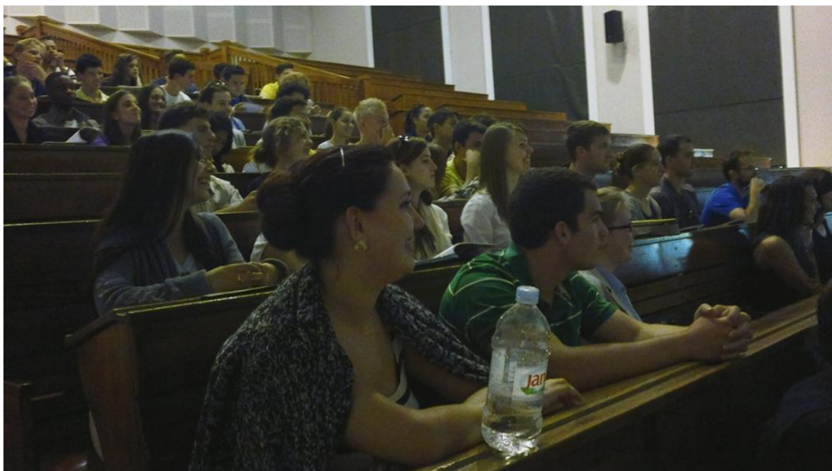
Atmosfera s uvodnog sastanka za studente prve godine, održanog 26. rujna 2013.