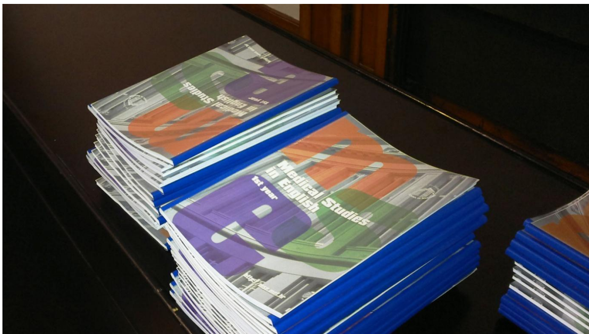
Izvedbeni nastavni plan i program 1. godine svježe tiskan za bruoše