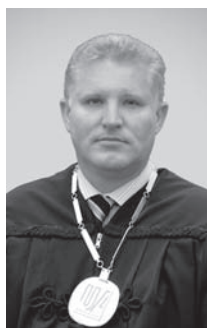
Vladimir Šimović Učiteljski fakultet