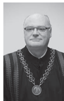
Andrija Bogner Šumarski fakultet