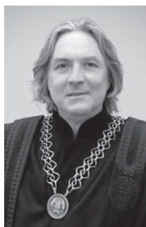
Lenko Pleština Arhitektonski fakultet