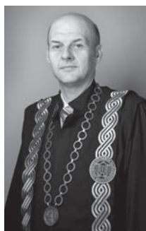
Stanislav Kurajica Fakultet kemijskog inženjerstva i tehnologije