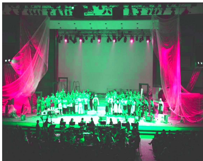
Scena iz Čarobne frule u Lisinskom