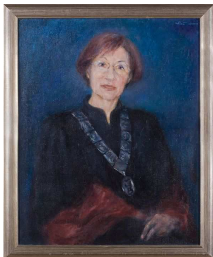
Portret H. J. Mencer (Galerija rektora - aula) Autor: Zlatko Kauzarić Atač, Zagreb 2006.