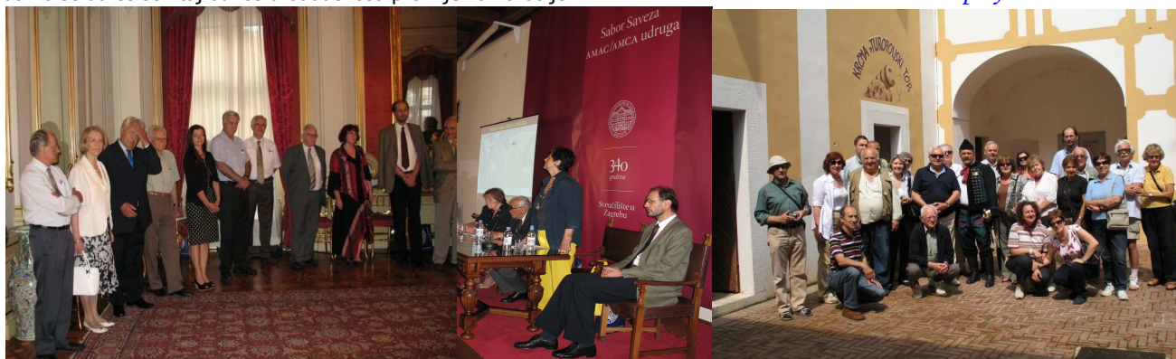
Sudionici Sabora imali su 2. srpnja 2009. primanje s prigodnim koncertom i domjenkom u gornjogradskoj palači Dverce, a 3. srpnja 2009. proveli su u ugodnom druženju na izletu po »Plemenitoj općini Turopolje«