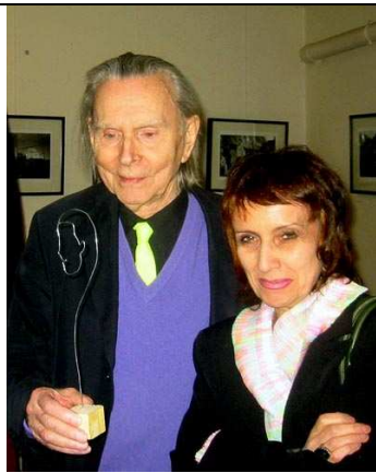
Radovan Ivšić s Annie Le Brun