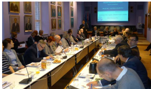
Okrugli stol Zaklade održan u suradnji s AMAC Savezom, 18. prosinca 2012.

Zaklada Sveučilišta u Zagrebu ima, kao posebne zadaće unutar svoje misije, za cilj postići povjerenje akademske i šire društvene zajednice i biti čimbenikom društvenih promjena koje će pridonijeti renesansi filantropije i zakladništva u Republici Hrvatskoj.