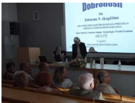
9. skupština Udruge, 27. lipnja 2012.