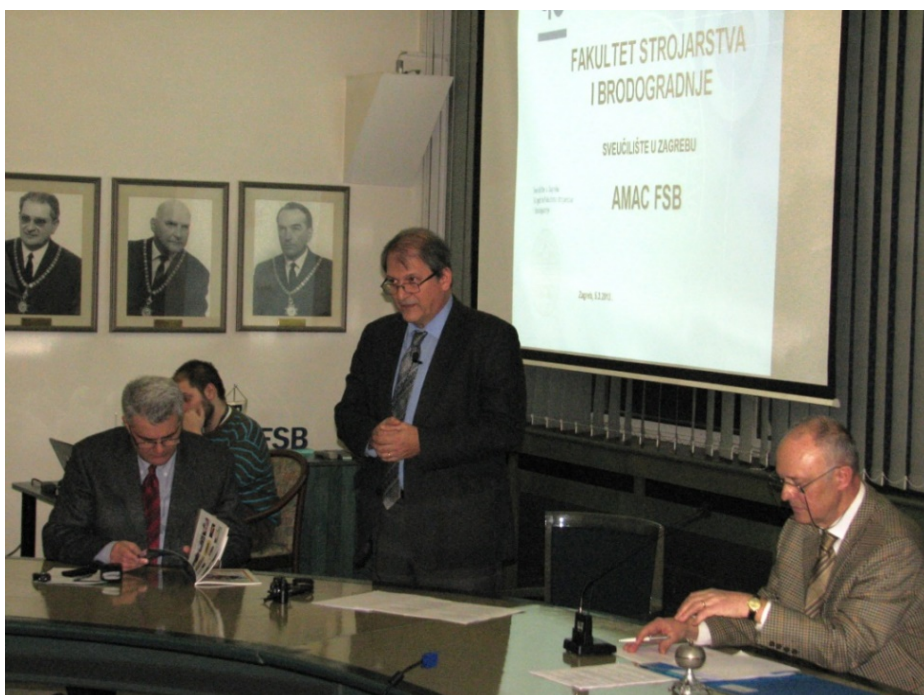
Skupština Udruge, 5. ožujka 2013.