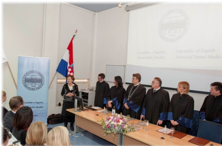
Dan Stomatološkog fakulteta Sveučilišta u Zagrebu i dan sv. Apolonije, 8. veljače 2013.